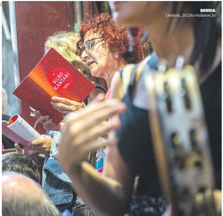
Bilbo Kantari egitasmoko kide bat, Aste Nagusian kantuan, liburuxka batekin.

Aplikazioa erraz deskargatzen da, eta erraz erabili. Kantu taldeen liburuxkak daude zerrenda batean –Plentzia Kantagune eta Zar-